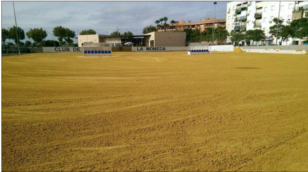
Figura 2. Campo de La Moneda C.F.

El objetivo principal de este Club es la formación físico-deportiva del niño, así como la creación de un hábito saludable que perdure en el tiempo. Se apoyan en los siguientes aspectos: